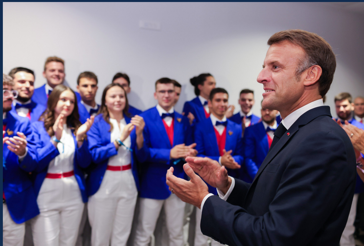
Emmanuel Macron, le Président de la République venu soutenir l'Équipe de France lors de la cérémonie d'ouverture