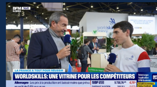
Interview d'un compétiteur sur BFM Business