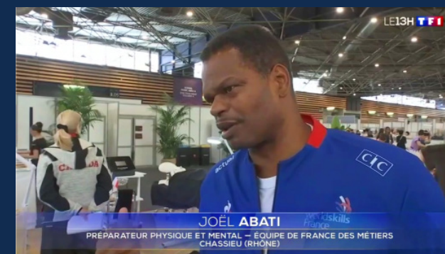
Journal télévisé de 13h sur TF1